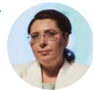
Евгения Карловская Ректор НИУ «БелГУ»

«Самым важным, что мы должны сохранить, является наш коллектив: замечательные педагоги, уважаемые учёные и, конечно, студенческое сообщество, которое насчитывает сегодня более 27 тысяч молодых людей из разных регионов России и порядка 100 стран мира»